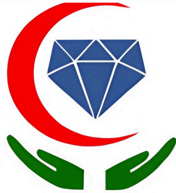
مستشفى البرلنتي Al-Brillanto Hospital

نفخر بخدمة مجموعة متنوعة من العملاء والمنشآت في القطاعين العام والخاص، ونسعى دائماً لتقديم حلول استراتيجية تعزز استقرارهم ونموهم.